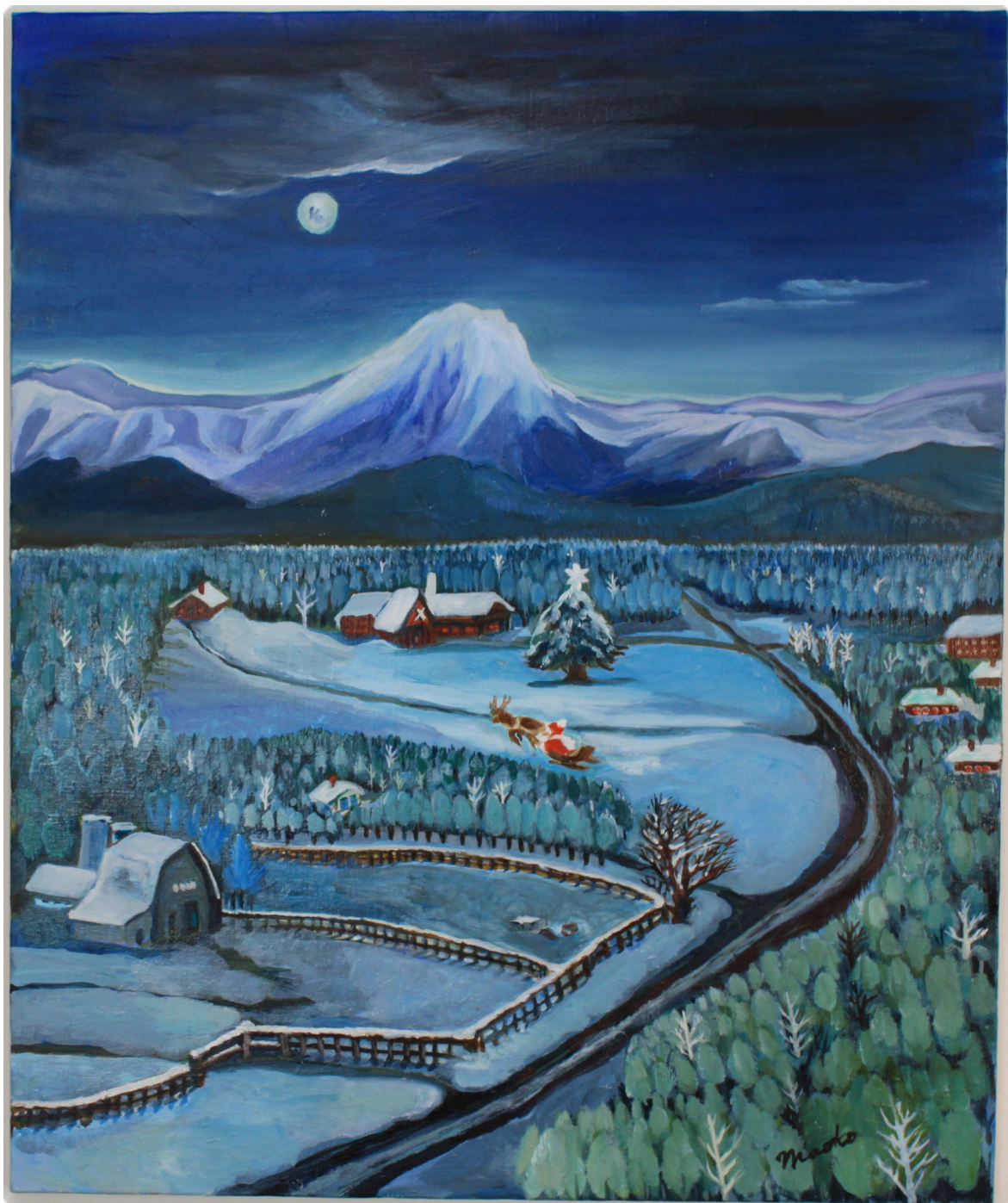
A-1：クリスマスの夜に(F20)：2018年制作